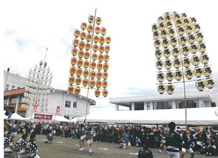
強風の中、秋田市竿灯会による妙技が披露されました