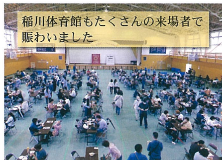
稲川体育館もたくさんの来場者で賑わいました