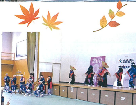
無形文化遺産に登録された西馬音内盆踊り披露